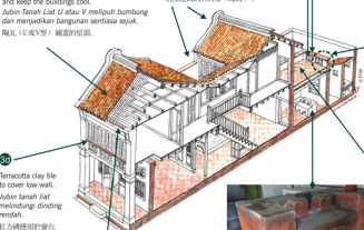
Terracotta clay tile to cover low wall. Jubin tanah liat melindungi dinding rendah. 紅方磚應用於矮台。