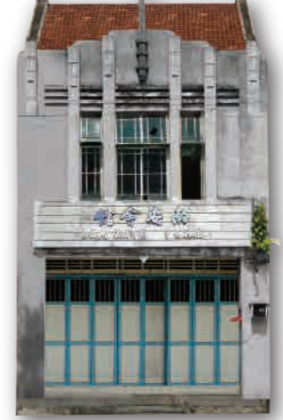
屋子外观 ◆ 二至三层楼 ◆ 欧洲元素: 艺术装饰的门面 突显水平和垂直线条的设计风格 ◆ 洗石子上墙表面、铁框玻璃窗 ◆ 矮墙上有浮雕字体 ◆ 阶梯状屋顶的女儿墙、旗杆