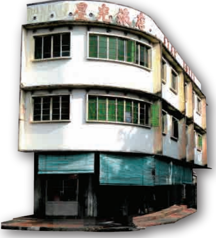
屋子外观 ◆ 二至三层楼 ◆ 新的建筑科技与材料促成现代化 简约的建筑构造和设计风格 ◆ 遮阳板、铁框玻璃窗