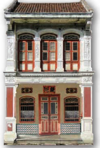
屋子外观 ◆ 二至三层楼 ◆ 中国元素: 两叶木制雕花门、气窗、山墙、天井等等 ◆ 欧洲元素: 二楼落地百叶窗、拱圈、付壁柱、托架、泥塑装饰、底楼水泥花砖及窗口下的彩釉瓷砖