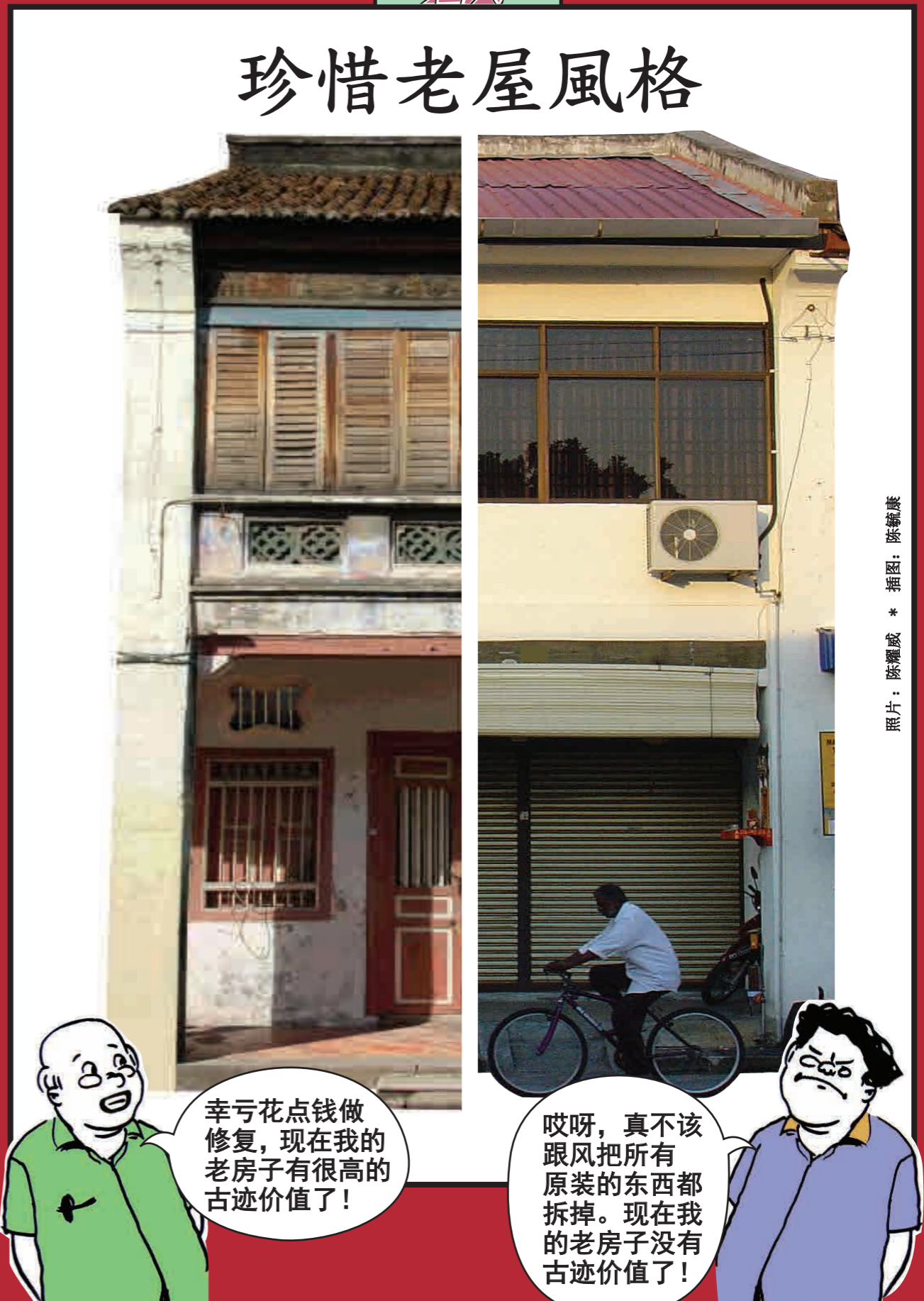
插图: 陈毓康