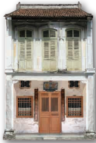
屋子外观 ◆ 二至三层楼 ◆ 中国元素: 两叶木制雕花门、气窗、山墙、天井等等 ◆ 欧洲元素: 二楼落地百叶窗、底楼拼花地转