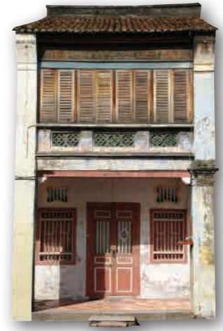
屋子外观 ◆ 二至三层楼 ◆ 门面设计从简朴到豪华 ◆ 中国元素: 两叶木制雕花门、气窗、山墙、天井等等 ◆ 欧洲及印度元素: 木百叶窗、U或V形陶瓦