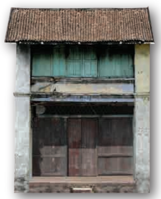
屋子外观 ◆ 一至二层楼 (构造矮小偏短) ◆ 门面设计简朴